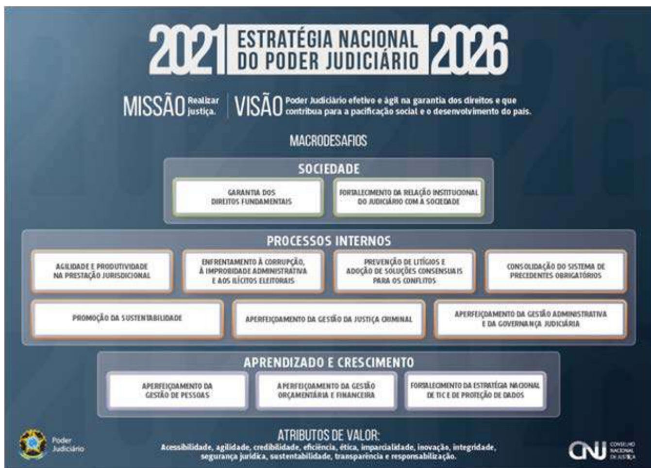
Fig. 1 – Macrodesafios do CNJ